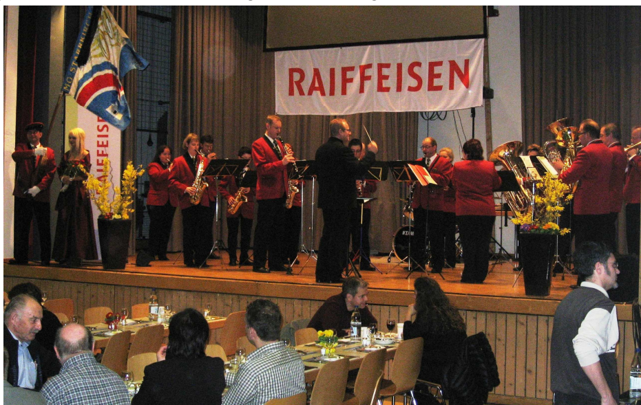
Die MG beim Auftritt in der Mehrzweckhalle!