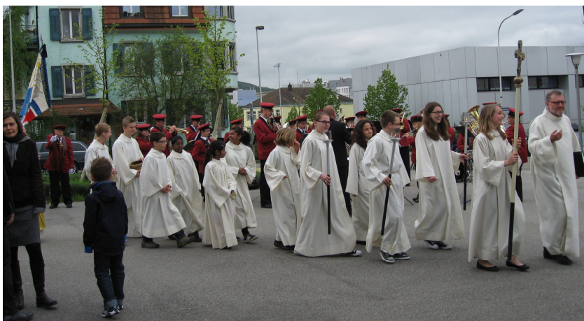
Konzert vor der St. Marien-Kirche in Olten vom 28. April 2013